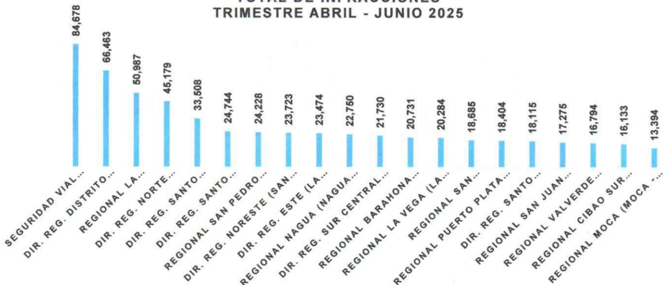
TOTAL DE INFRACCIONES TRIMESTRE ABRIL - JUNIO 2025